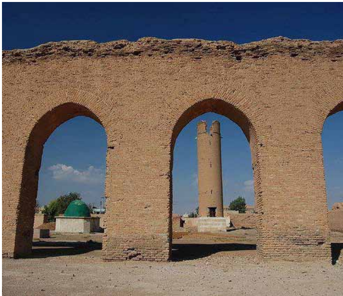
• الجامع العتيق . الرقة