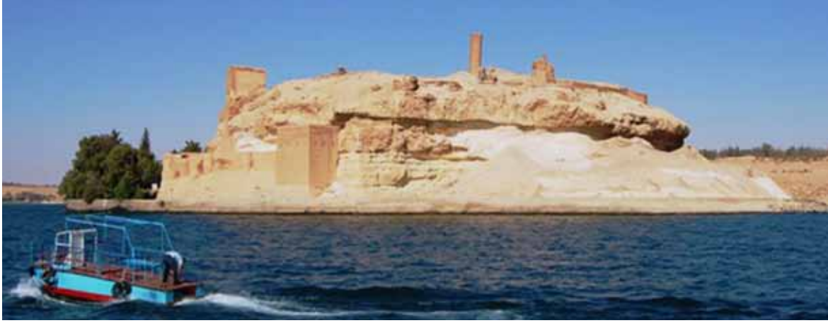
• قلعة جعبر . الرقة