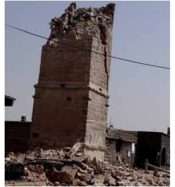
• مئذنة الجامع العمري . درعا

يتم العمل بشكل ممنهج اليوم على وأد حضارة ضاربة جذورها في عمق التاريخ.❶