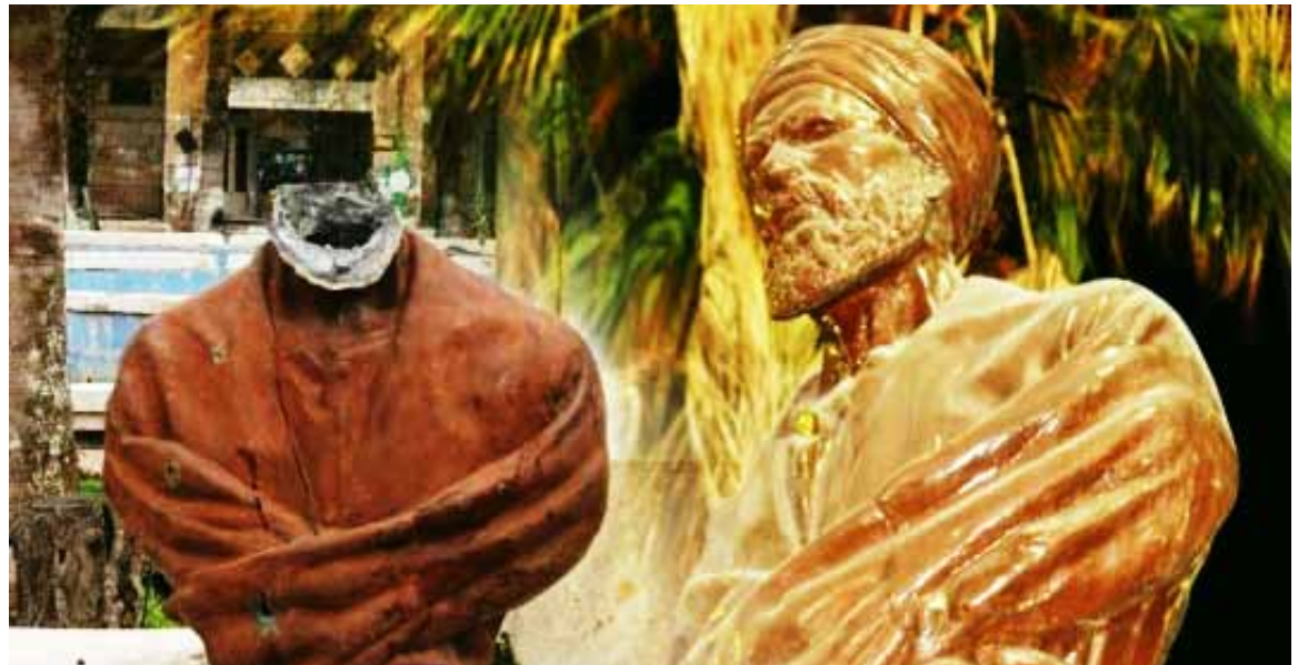
• تمثال أبي العلاء المعري . معرة النعمان