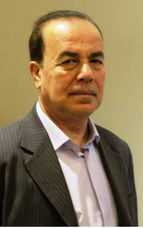
• خطيب بدلة

ويضيف، «إن الحراك الشعبي كسر حاجز الخوف رغم ما عاناه من طعن تكفيري مؤقت لخاصته، نعم، وتجاوز ثقافة مسببة مألوفة اعتدناها خلال أربعة عقود، ثقافة منتخبة واقعة بقبضة أدباء وكتاب وصحفيين تحت ما يُسمى (النخبة المثقفة) تجاوزها الحراك إلى نطاق ثقافي جديد لم يكن مألوفاً في مجتمعنا ألا وهو: نطاق ثقافة الشباب».