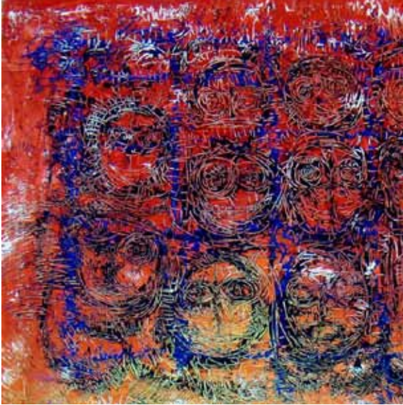
• لوحة الفنان: إسماعيل سلمان

في فنها على تجسيد جماليات الطبيعة حول طبيعة جبال لبنان، وبأسلوب تجريبي يميل إلى استخدامات اللون الواحد البني وتدرجاته الهارمونية والمونوكرامية، تبقى تسكن ألوانها أبعاد نفسية تحاول الفنانة الإفصاح عنها في تلافيف داخل العمل الفني.