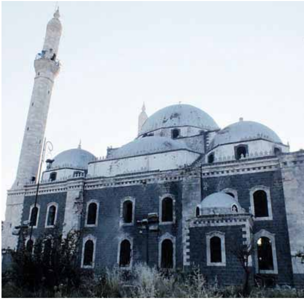
• جامع خالد بن الوليد . حمص

تعرضت معظم الأوابد الأثرية والتاريخية في سورية لانتهاكات الجماعات الإسلامية المتطرفة المتشددة، حيث تم استهداف الجامع الأموي في مدينة حلب، والجسر المعلق في مدينة دير الزور، ومسجد وضريح خالد بن الوليد في مدينة حمص، وهدم مقام نبي الله إبراهيم في مدينة تل أبيض، ونُش قبر الصحابي الجليل حجر بن عدي في ريف دمشق والمسجد العمري في درعا... إلخ.