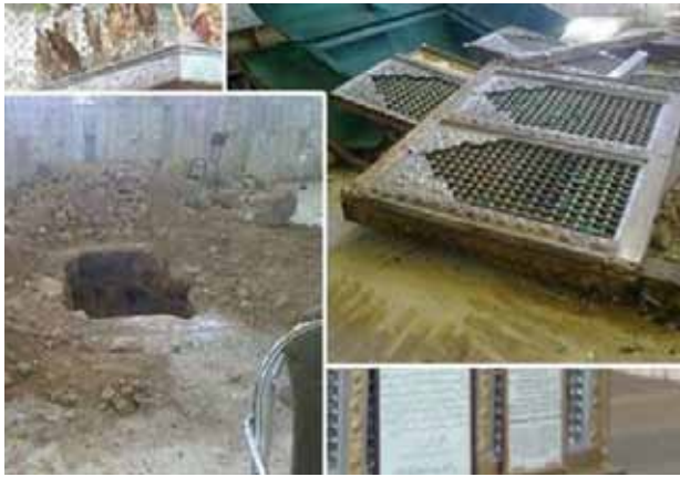
• قبر الصحابي حجر بن عدي . ريف دمشق