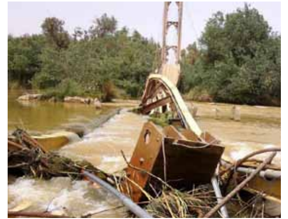
• الجسر المعلق . دير الزور