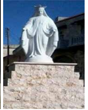
• تمثال السيدة العذراء . جسر الشغور